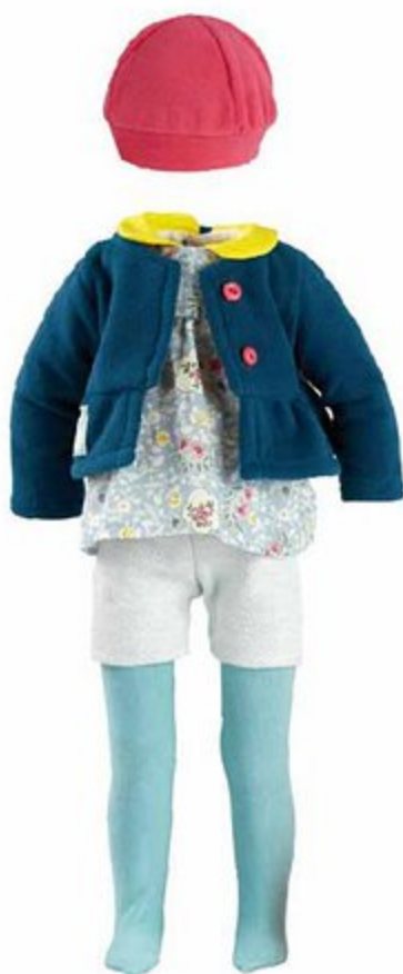
504809 Pour Finouche 48 cm HANNAH