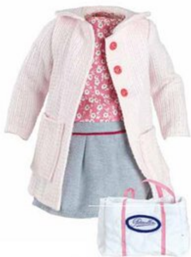
504810 Pour Finouche 48 cm NOÉMIE