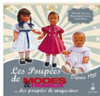
LIVRE 7 Les poupées de Modes & Travaux 23 x 23 cm - 180 pages