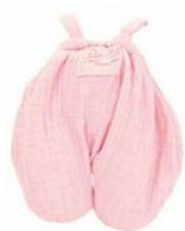
502826 Pour Petit Câlin 28 cm et Câlinette 28 cm ELISE