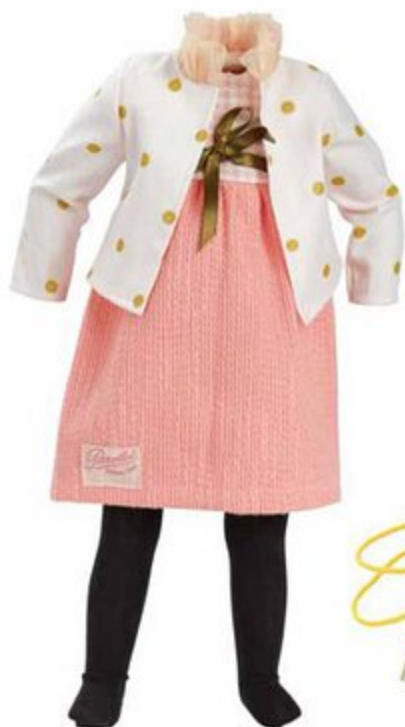
504811 Pour Finouche 48 cm ALIX