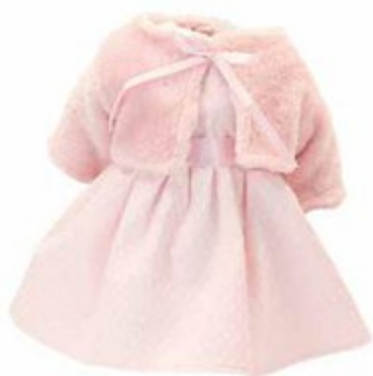
504047 Pour poupées 40 cm TRIOMPHE