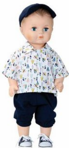
40 cm 204073 LOUIS