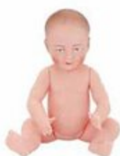
12 cm 201201