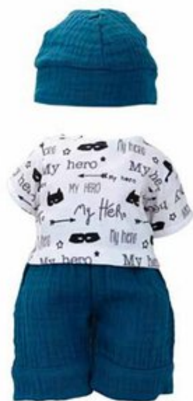
503631 Pour baigneurs 40 cm MARIUS