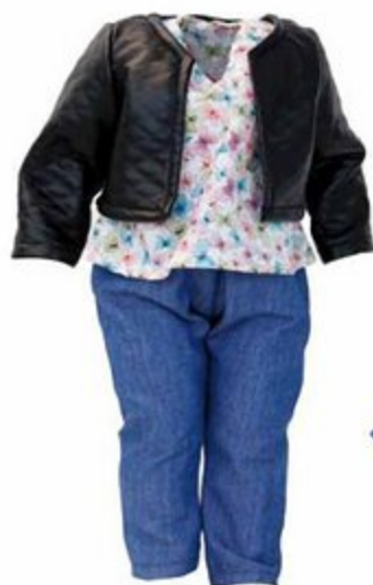
504065 Pour poupées 40 cm SAXE