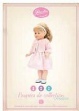
820152 Catalogue collection 21 x 30 x 0,5 cm