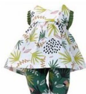
502814 Pour Petit Câlin 28 cm et Câlinette 28 cm LILOU