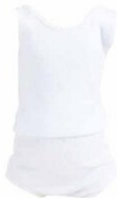
5041104 Pour baigneurs 40 cm