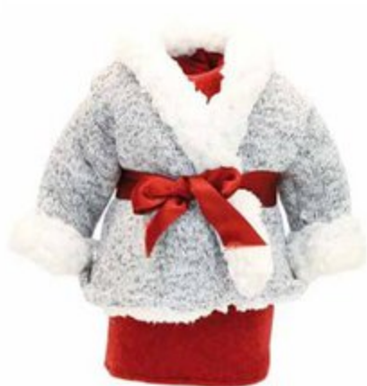
504056 Pour poupées 40 cm SACRÉ-COEUR