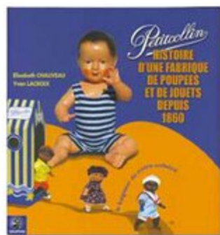
LIVRE Histoire d'une fabrique de poupées et de jouets depuis 1860 21 x 23 x 1,5 cm