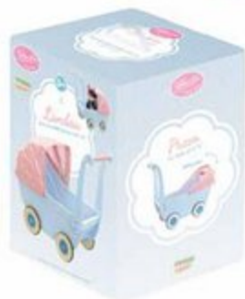
Landaus en osier pour poupées jusqu'à 40 cm Wicker pram for dolls up to 40 cm/16" 60 X 30 X 40 cm