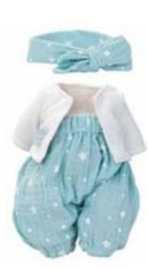
502813 Pour Petit Câlin 28 cm et Câlinette 28 cm MARILOU