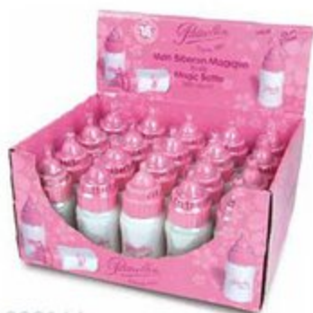
800164 Présentoir de 20 biberons magiques bruités Display of 20 magic bottles with sound 12 cm