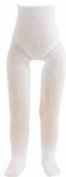
5041111 Pour poupées de 39 à 48 cm