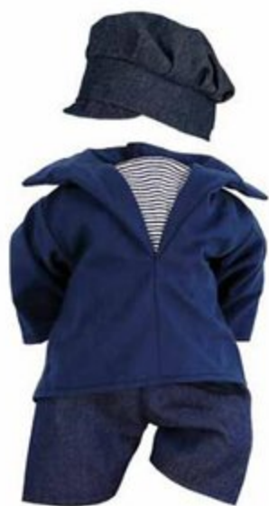
504044 Pour baigneurs 40 cm MARIN