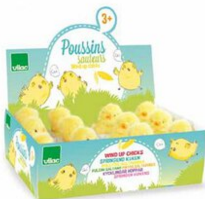
800704 Lot de 12 poussins sauteurs Set of 12 wind up chicks