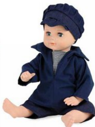
40 cm MARIN 204041 204042