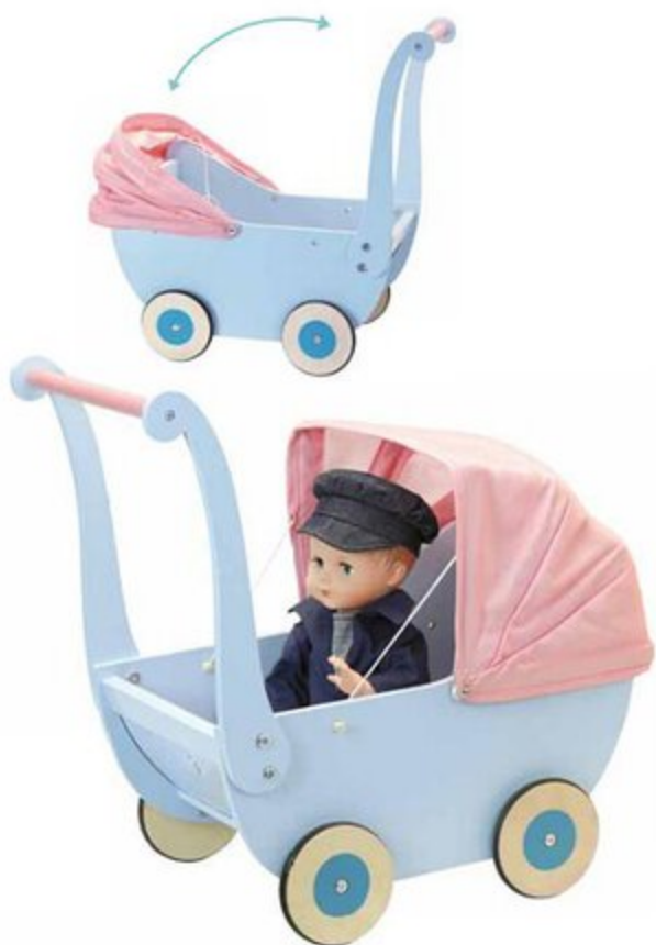
800217 Landau en bois pour poupée jusqu'à 40 cm Wooden pram for dolls up to 40 cm/16" 50 X 50 X 30 cm 19,6" x 19,6" x 11,8"