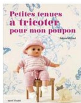
LIVRE 8 Petites tenues à tricoter pour mon poupon 19 x 14,5 cm - 80 pages