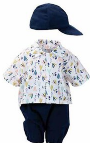
504073 Pour poupées 40 cm LOUIS