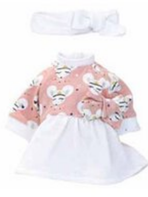
502806 Pour Petit Câlin 28 cm et Câlinette 28 cm MAYA