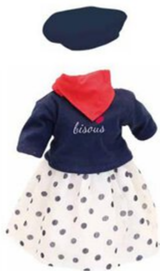
504039 Pour poupées 40 cm MONTMARTRE