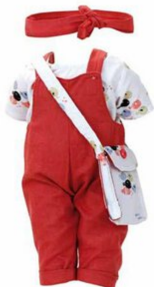
503913 Pour poupées 40 cm CORAILLE