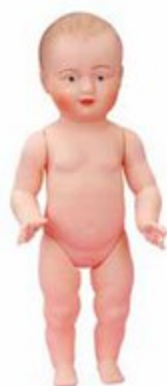
15 cm 201503