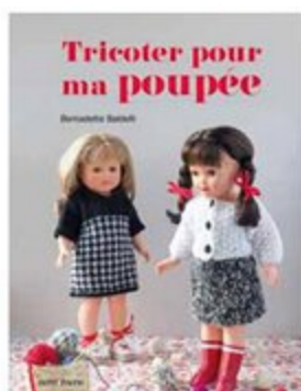
LIVRE 4 Tricoter pour ma poupée 19 x 24,5cm - 96 pages