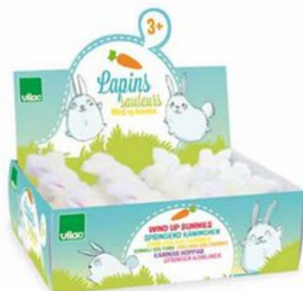
800702 Lot de 12 lapins sauteurs Set of 12 wind up rabbits