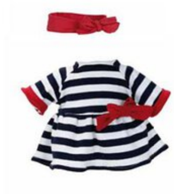
502821 Pour Petit Câlin 28 cm et Câlinette 28 cm ROSALIE