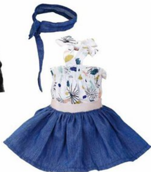
504003 Pour poupées 40 cm MIDI