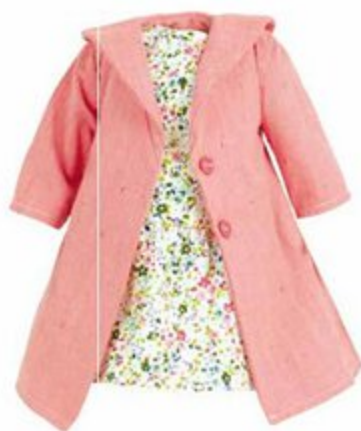
504052 Pour poupées 40 cm BELLEVILLE