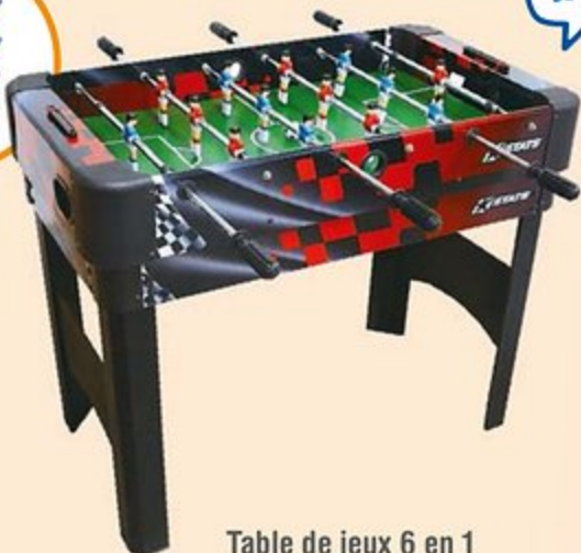
Table de jeux 6 en 1

Se transforme en billard, babyfoot, hockey de table, tennis de table mais aussi backgammon ou encore jeu de dames, en utilisant la même aire de jeux ! Pratique et transportable, cette table se monte en quelques minutes. Elle est parfaitement adaptée en intérieur comme pour des activités au-dehors. Solide et stable, cette table accompagnera vos enfants dans leur développement. Dim. 108,7 x 55,1 x 15,2 cm.