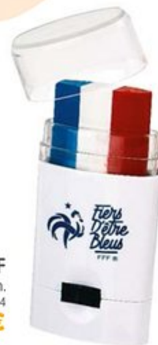
Stick de maquillage FFF Avec molette et capuchon. 324914 7-9 €