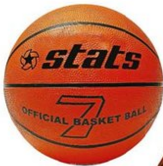
Ballon Basketball Taille 7. Dès 3 ans - 134433 8-10 €