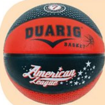
Ballon de Basket American League Taille 7. Dès 3 ans - 083175 15-17 €