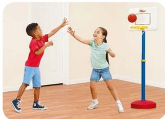
Set de Basketball Hauteur réglable : 76 à 122 cm. Ballon de basket, pompe de gonflage, base, panier et filet inclus. Dès 3 ans - 908830 25-30 €