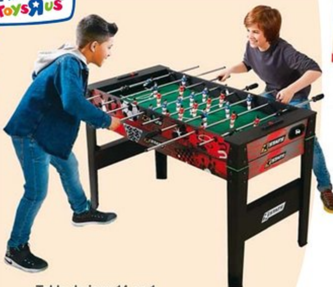
Table de jeux 14 en 1

Pour s'amuser en famille, grâce à la table de jeu 14 en 1, vous êtes assuré de faire plaisir au plus grand nombre ! Cette table Multi-jeux comprend les jeux suivants : Baby-Foot, Billard, Hockey, Ping-Pong, Jeu de dés, Black Jack, Jeu de dames, Jeu d'échecs, Backgammon, Loto Bingo, Jeu de l'échelle, Lancer d'anneaux et fer à cheval, Morpion, Mikado. Dim. 122 x 62 x 85 cm.