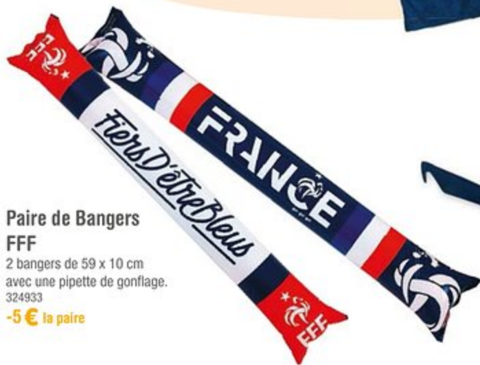
Paire de Bangers FFF 2 bangers de 59 x 10 cm avec une pipette de gonflage. 324933 -5 € la paire