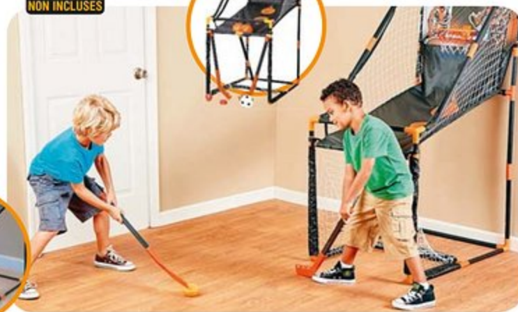
Table multi-jeux 3 en 1 Facile à assembler. Tableau électronique d'affichage des résultats avec bruits de stade. Se transforme facilement en panier de basket, terrain de foot ou de hockey. Contient : 1 ballon de foot, panier de basket un seul tir, 2 ballons de basket, cage de foot, 2 bâtons de hockey, palet de hockey, balle de hockey, pompe à air et aiguille. Dim. 91,4 x 62,2 x 144,8 cm. Dès 3 ans - 799750 40-50 € l'unité