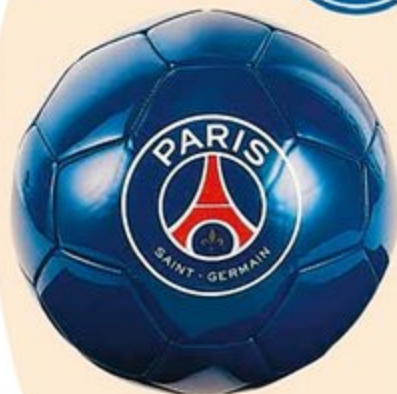
Ballon PSG Taille 5. Dès 3 ans - 753319 18-23 €