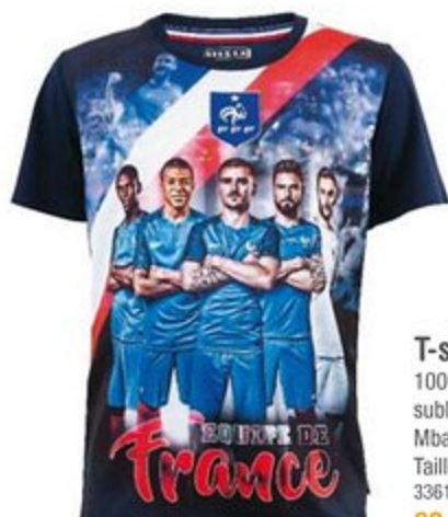
T-shirt Players 100% polyester avec marquage en sublimation reprenant un visuel de Pogba, Mbappé, Griezmann, Giroud et Lloris. Taille de 6 à 12 ans. 336117 20-25 €