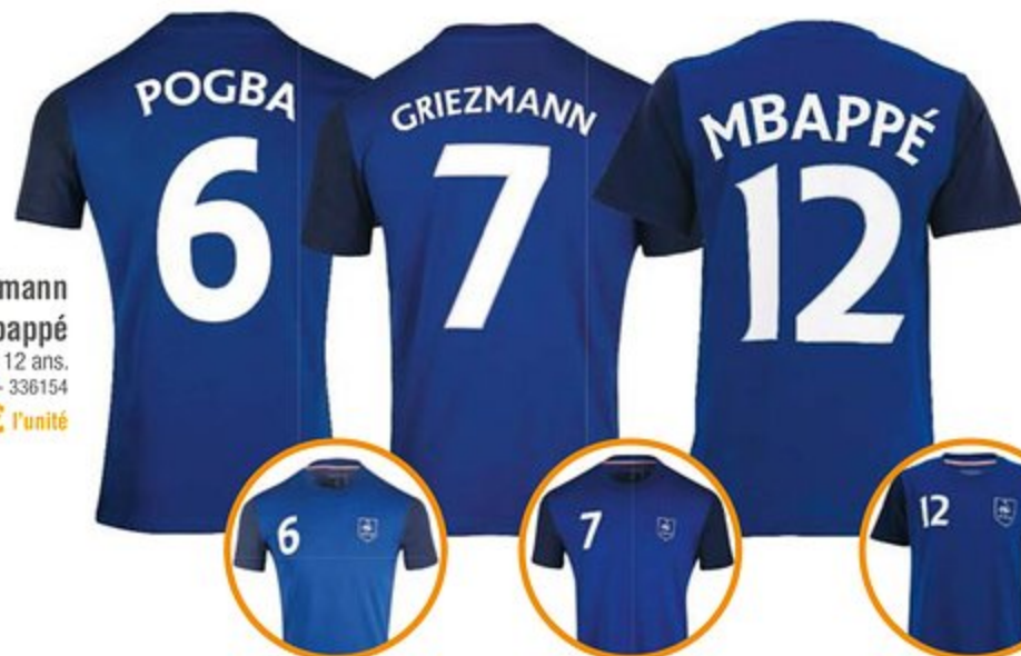
T-shirt Pogba, Griezmann ou Mbappé 100% coton. Taille de 6 à 12 ans. 336152 - 336149 - 336154 14.99 € l'unité