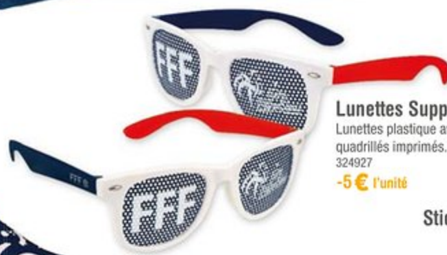
Lunettes Supporter Lunettes plastique avec verres quadrillés imprimés. Taille unique. 324927 -5 € l'unité