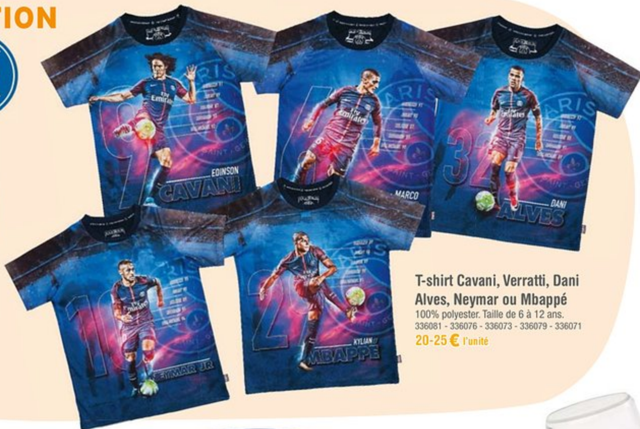
T-shirt Cavani, Verratti, Dani Alves, Neymar ou Mbappé 100% polyester. Taille de 6 à 12 ans. 336081 - 336076 - 336073 - 336079 - 336071 20-25 € l'unité